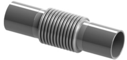
| Tip HWA - Compensator Axial | vedere 3D

Pentru mai multe detalii tehnice si/sau solicitarea unei oferte referitoare la compensatorii model HWA, va rugam consultati materialele urmatoare sau contacteaza-ne .