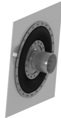
| Tip 35 - Compensator panza | vedere 3D

Pentru mai multe detalii tehnice si/sau solicitarea unei oferte referitoare la compensatorii de tip 35, va rugam consultati materialele urmatoare sau contacteaza-ne .