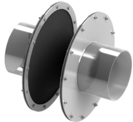
| Tip 43 - Compensator panza | vedere 3D

Pentru specificații tehnice detaliate despre îmbinările de extindere a țesăturilor de tip 43, va rugăm consultați materialele următoare sau contactați-ne .